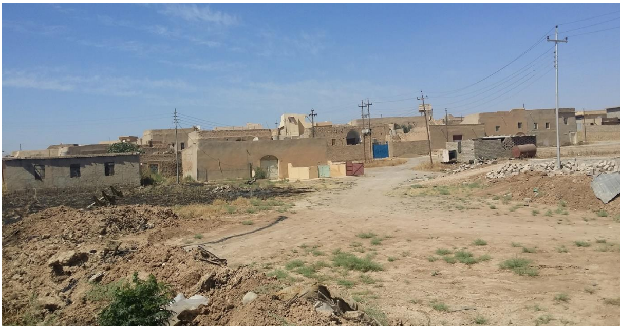
Baqofa, Ninive-Ebene, Nordirak