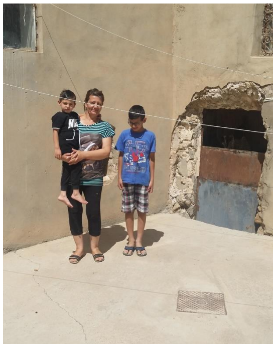
Zurückgekehrte christliche Familie

Die chaldäische Kirche hat für Baqofa und die benachbarte Kleinstadt Telskuf eine eigene Kommission eingerichtet, die für den Wiederaufbau zuständig ist. (In Telskuf lebten vor dem Krieg 1.450 Familien. 500 sind inzwischen zurückgekehrt, rund 250 könnten mittelfristig noch dazukommen. In Telskuf gibt es zwei Kindergärten, 2 Volksschulen, 2 weiterführende Schulen, eine technische Schule. Alle müssen derzeit ebenfalls repariert und renoviert werden. Auch in Telskuf ist die Kirche beschädigt, allerdings nicht so schwer wie in Baqofa.)