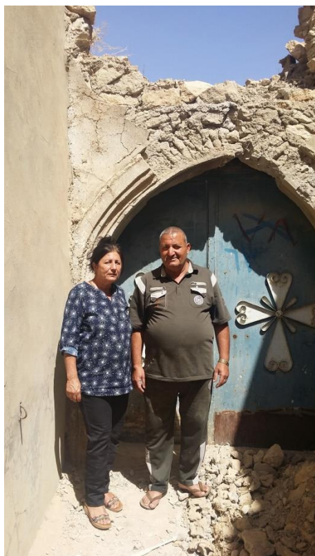
Der Bürgermeister von Baqofa mit seiner Frau